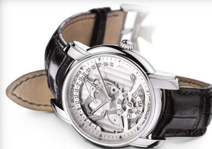
Orologio scheletrato in platino, data retrograda, ref. 47247-2002