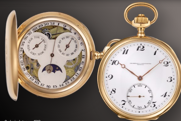
Orologio da tasca - 1918

Nel 2019 si è inserito in questa dinamica il Traditionnelle Twin Beat calendario perpetuo, facendo leva sulla tensione tra stile contemporaneo e forza della tradizione. Si è trattato di un'autentica pietra miliare. Due anni dopo, nel 2021, ha visto la luce un nuovo modello: il Traditionnelle calendario completo openface. Questa elegante referenza, presentata in una cassa del diametro di 41 mm in oro bianco o rosa con quadrante in vetro zaffiro scheletrato, ha inaugurato nuove possibilità creative, combinando la tradizione/eredità orologiera con il design contemporaneo.