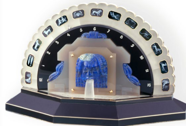
Pendola Art Déco in oro giallo, onice, cristallo di rocca e lapislazzuli (Ref. Inv. 10548) – 1927

Erede delle Referenze 47245 e 47247 dei primi anni duemila, il Traditionnelle tourbillon data retrograda openface combina l'indicazione retrograda con un quadrante parzialmente scheletrato, un'altra firma della Maison risalente all'inizio del XX secolo. I quadranti openface evidenziano la natura tecnica e l'attenzione meticolosa e costante ai dettagli attraverso un approccio estetico all'avanguardia. Dotato di una cassa in oro rosa del diametro di 41 mm e dello spessore di soli 11,07 mm, questo nuovo segnatempo è dotato di un cinturino in alligatore grigio con fibbia déployante in oro rosa.