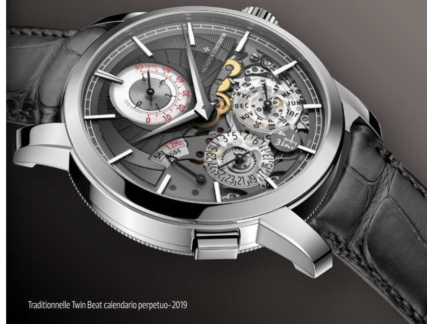
Traditionnelle Twin Beat calendario perpetuo-2019